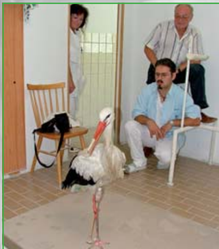
Čáp bílý s protézou od Tomáše Tykala a Jana Sýkory z Technickoprotetického pracoviště Plzeň.