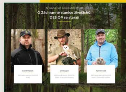
Tým záchranných stanic živočichů